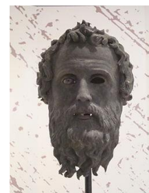
Antisthène, fondateur de l'école cynique

L'école cynique prône la vertu et la sagesse, qualités qu'on ne peut atteindre que par la liberté. Elle est connue principalement par les propos et les actions spectaculaires de son disciple Diogène .