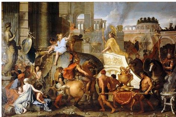
L'entrée d'Alexandre Le Grand à Babylone ou Le Triomphe d'Alexandre