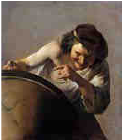
Démocrite, le philosophe rieur

Diego Velázquez et Jusepe de Ribera ont conçu des portraits imaginaires de philosophes, de fabulistes, de poètes, de savants antiques. Les peintres Espagnols du Siècle d'or n'ont pas l'apanage de ce genre mais le traitent dans un esprit dont on ne trouve nul équivalent ailleurs.