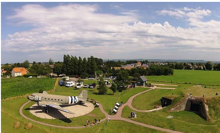
Batterie de Merville

Batterie de Merville. Située à quelque deux kilomètres de la mer, la Batterie allemande de Merville permet de comprendre le fonctionnement d'une batterie d'artillerie, les étapes de sa construction, l'intérêt qu'y portait Rommel et la vie quotidienne des soldats qui y étaient cantonnés. Le rôle de la Batterie de Merville était de défendre