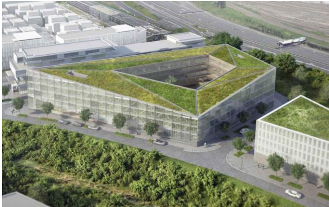
Le futur Rectorat d'académie à Euralille 2

moderne à cette ambition. De grands noms de l'architecture contemporaine participent au projet, véritable "fracture architecturale" aux portes de la ville ancienne.