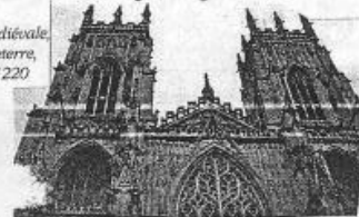
Les vitraux de la cathédrale d'York