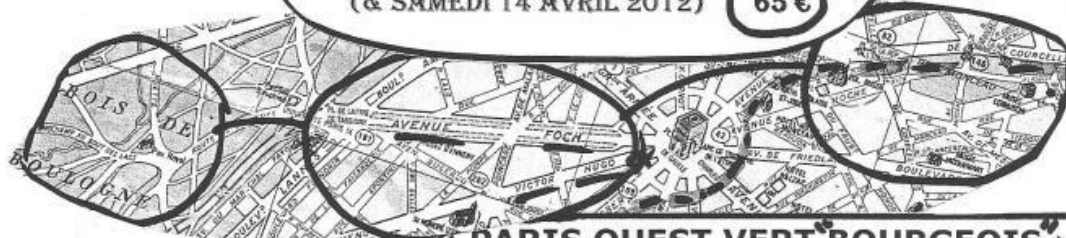
LE PAVILLON LEDOUX