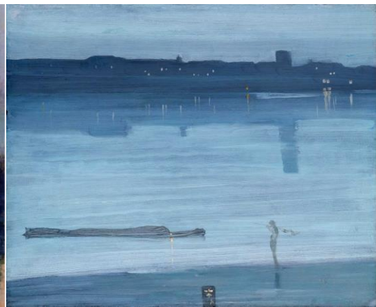
John McNeil Whistler, Nocturne : Blue and Silver

Les 24 Préludes pour piano de Claude Debussy furent composés entre décembre 1909 et avril 1913. Avec « En Blanc et Noir » et le recueil des « douze Études pour piano », ils marquèrent l' aboutissement de la pensée pianistique de Debussy .